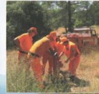
Extinction des fumerolles