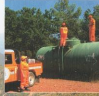
Surveillance des citernes