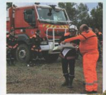
Guidage des secours