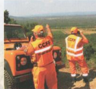
Surveillance - Détection - Alerte

L'action des Comités Communaux Feux de Forêts et des Réserves Communales de Sécurité Civile est complémentaire de celle des sapeurs-pompiers.